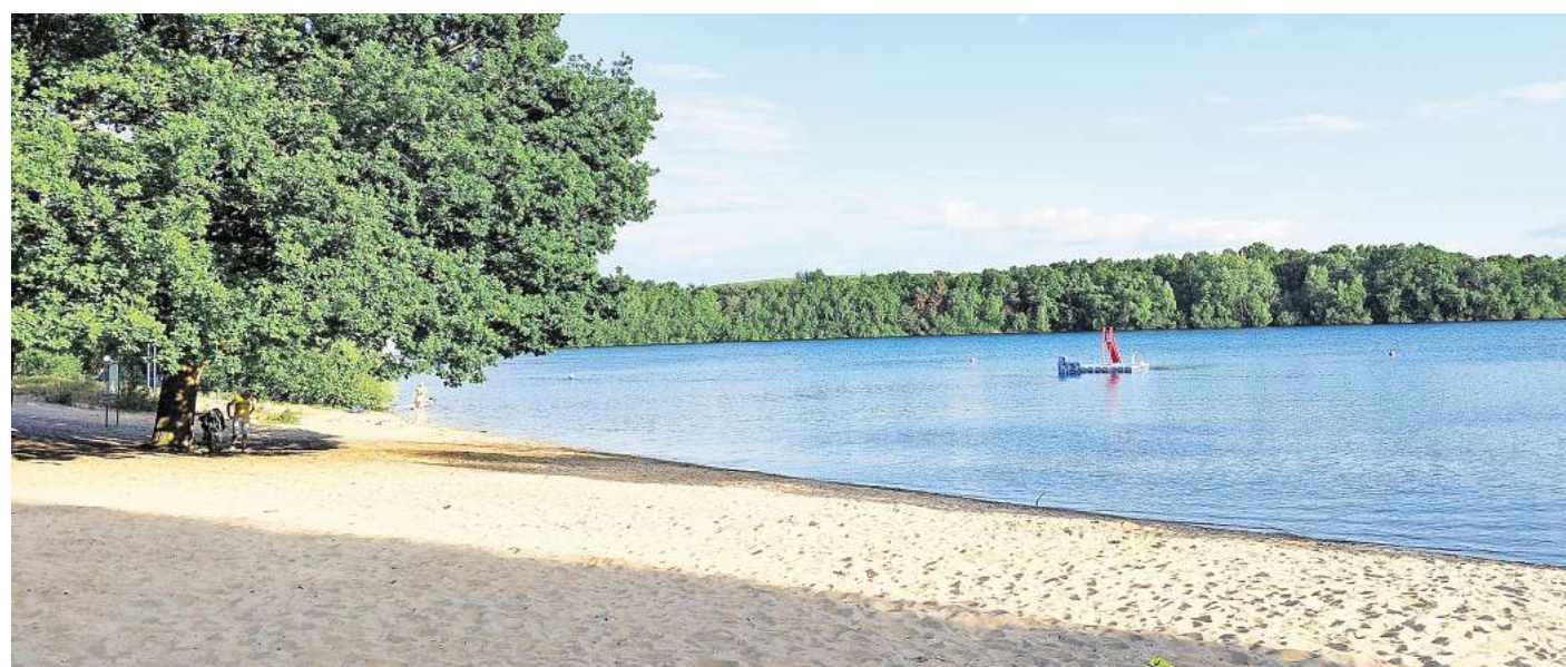
Bereit für die Saison: Sandstrand und Badeinsel warten am Altwarmbüchener See auf die Badegäste.