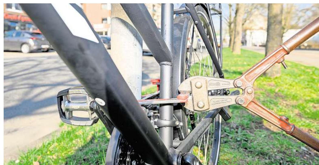
„Gelegenheitsdiebe suchen das schnelle, einfache Ziel“: In Hannover ist die Zahl der gemeldeten Fahrraddiebstähle deutlich gesunken.

Die Polizei empfiehlt außerdem, Fahrräder codieren zu lassen. Dann sind sie als Diebesgut schwerer zu verkaufen. Den individuellen Ziffern- und Buchstabencode können Eigentümer beim Fachhändler oder beim ADFC in den Rahmen gravieren lassen. Auch ein Fahrradpass mit Fotos, Rahmennummer und weiteren Details erleichtere die Identifizierung im Fall eines Diebstahls.