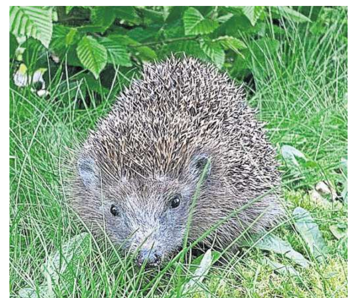
Igel können durch Mähroboter schwer verletzt werden.

Zusätzliche Rückzugsräume wie Laub- oder Reisighaufen können den Tieren Schutz bieten. Solche Bereiche sollten konsequent von der Mahd ausgeschlossen werden. RED