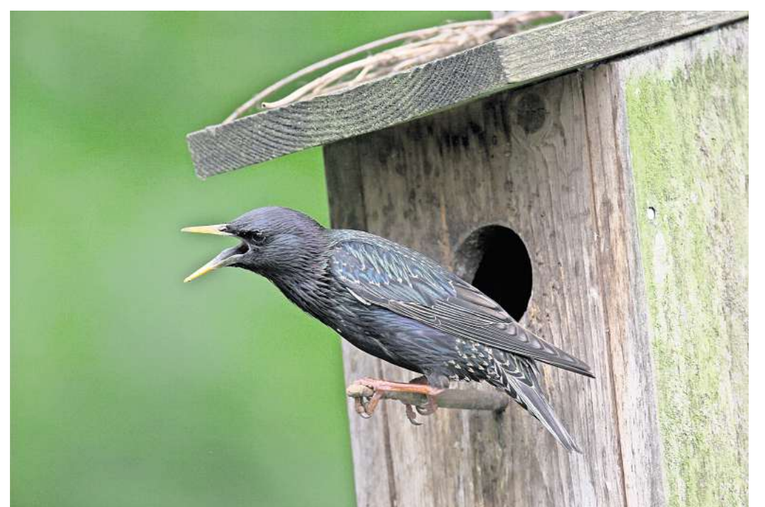
Für Stare sind klassische Höhlenbrüterkästen mit einem einzigen Einflugloch sinnvoll.

Neben der Auswahl spielt auch die Platzierung des Nistkastens eine wichtige Rolle. Dieser sollte in 1,5 bis 3 Metern Höhe und mit der Front nach Möglichkeit nach Osten oder Südosten platziert werden, damit er sich nicht zu sehr aufheizt. Auch sollten Maßnahmen gegen Nesträuber getroffen werden, erklärt die LBV-Biologin Angelika Nelson. „Um die Brut vor Fressfeinden wie Katzen oder Mardern zu schützen, ist es empfehlens-