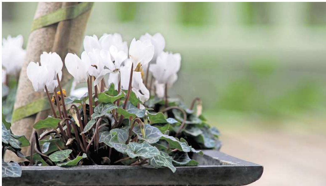
Rosa oder weiß: Wer kein leuchtendes Pink im Garten mag, sollte die Alpenveilchen-Sorte „Album“ wählen.

Im Herbst, wenn man sie schon längst wieder vergessen hat, bilden die Vorfrühlings-Alpenveilchen kleine, nierenförmige Blätter und tragen diese den ganzen Winter über. Bis ihre eigenen Blüten diesem Grün im Vorfrühling die Show stehlen und als kleine Schmetterlinge über dem Boden zu schweben scheinen.