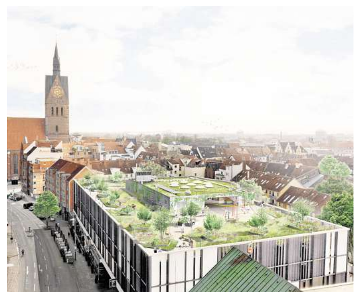
Grüne Aufenthaltsbereiche auf den Dächern der Stadt: So soll es später aussehen. Visualisierung: Rehwaldt Landschaftsarchitekten

Die „City Roofwalks“ reagieren auf zentrale Herausforderungen moderner Städte. Hohe Versiegelungsgrade, zunehmende Hitzeperioden und vermehrte Starkregenereignisse stellen Kommunen vor wachsende Aufgaben. Begrünte Dächer können zur Abkühlung beitragen, Regenwasser zwischenspeichern und zeitverzögert abgeben. Dadurch wird die Kanalisation entlastet und das Mikroklima verbessert. Zugleich entstehen zusätzliche Aufenthaltsflächen, die neue Perspektiven auf die Innenstadt eröffnen und Stadtleben auf einer weiteren Ebene ermöglichen. In der aktuellen Bauphase entstehen rund