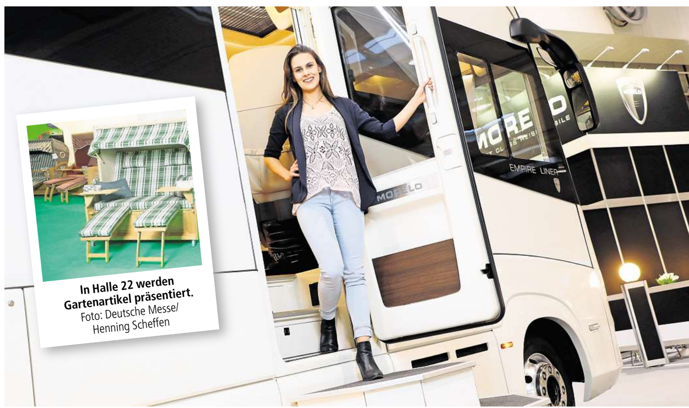
Die Themenwelt Caravaning & Camping ist eines der Herzstücke auf der ABF.

Ergänzt wird das Mobilitätsangebot durch die Themenwelt Fahrrad & Mobilität, die ein breites Spektrum an Fahrrädern, Pedelecs, Lastenrädern und weiteren E-Mobilitätslösungen vorstellt. Besucher haben die Möglichkeit, viele der ausgestellten Modelle vor Ort zu testen. Die Themenwelt Outdoor & Fitness ergänzt die ABF mit einem vielfältigen Programm rund um Sport, Bewegung und Aktivitäten im Freien. Hier zeigen Aussteller Sportgeräte, Outdoor-Ausrüstung und neue Trends für die aktive Freizeitgestaltung. Sportlich aktiv können Besucher am 14.2. beim ABF RUN werden, der zum zweiten Mal stattfindet. Mit unterschiedlichen Streckenlängen