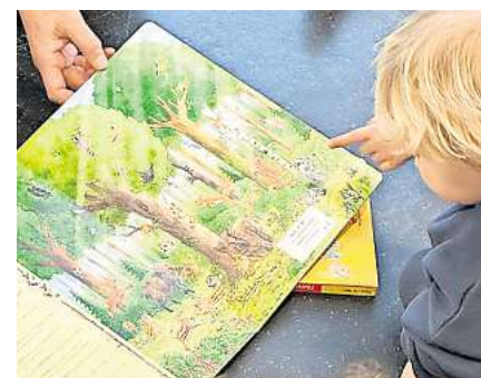
Lust aufs Lesen wecken: Bilderbücher für die Jüngsten.

Für Bewegung und Musik sorgt ein neues Angebot der Musikschule Hannover: „Wo die wilden Kerle wohnen“ wird um 12.30 Uhr und um 15 Uhr im Kleinen Saal als musikalisches Bewegungsangebot umgesetzt. Bereits ab 11 Uhr richtet sich „Babys in der Bibliothek“ mit Liedern, Fingerspielen und Instrumenten an die jüngsten Besucherinnen und Besucher; weitere Termine folgen bis 15 Uhr.