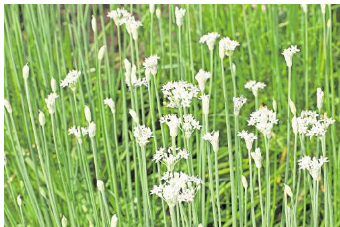
Die Blätter vom Schnitt-Knoblauch können als Gewürz eingesetzt werden.

Ob diese oder andere Gemüse einen Stammplatz im Garten verdient haben, ist natürlich Geschmackssache. Pflanzen Sie also nur Arten, die Sie gerne essen, und nutzen Sie die kommenden Wochen zum Probieren. Mit etwas Glück finden Sie Topinambur und manchmal sogar die hierzulande noch seltene Cardy in gut sortierten Gemüseläden.