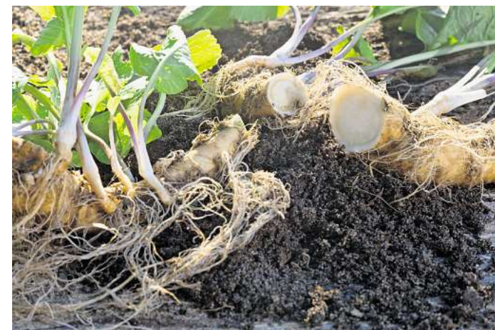
Vom Meerrettich werden die dicken Pfahlwurzeln in der Küche verarbeitet.