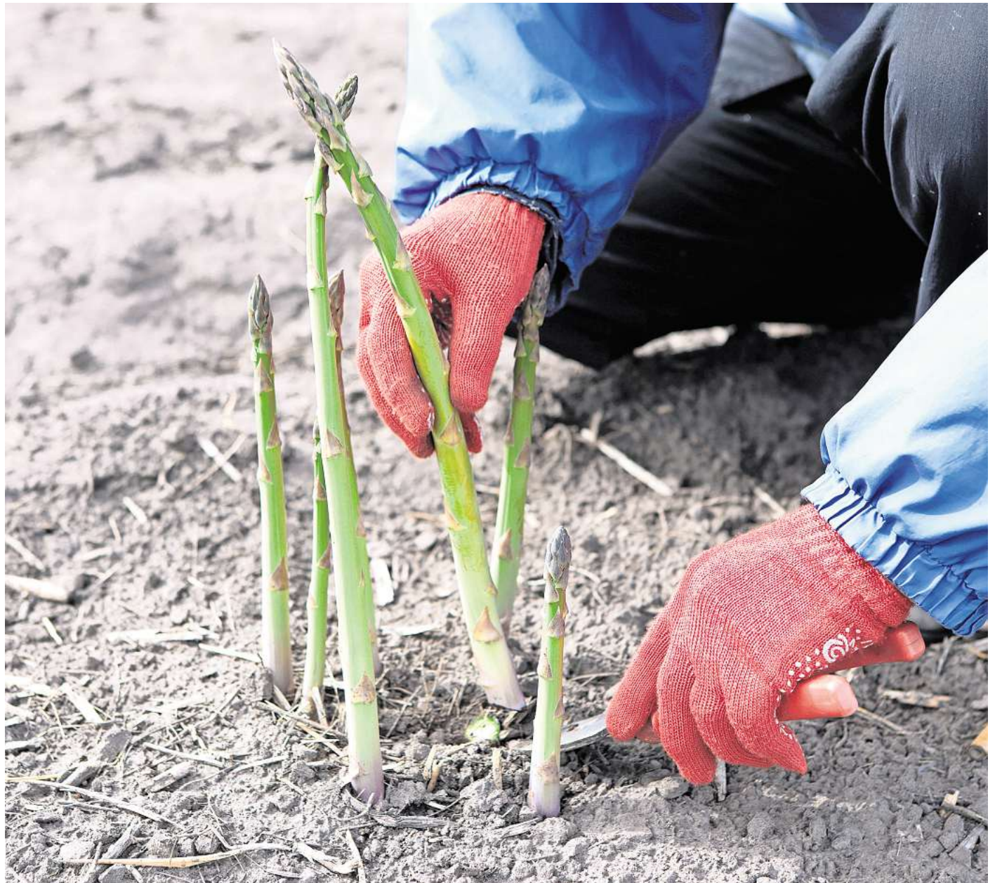
Spargel: Wächst auch im heimischen Gemüsebeet.

Grünpargel ist hierzulande bereits populär. Er wächst in voller Sonne und in durchlässigen, tiefgründigen Böden. Wie bei Rhabarber und Cardy werden auch beim Spargel Jungpflanzen im Frühjahr gesetzt: im Abstand von 25 bis 40 Zentimetern inner-