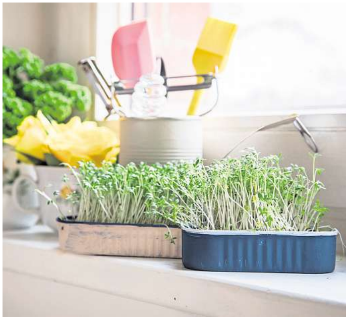
Manche Kräuter und Sprossen wie Kresse fühlen sich auf einer kühlen, hellen Fensterbank besonders wohl.