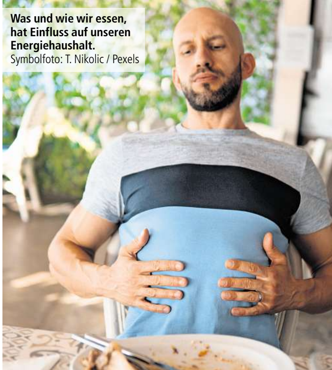
Was und wie wir essen, hat Einfluss auf unseren Energiehaushalt.

Wer die Möglichkeit hat, an seinem Arbeitsplatz ein kurzes Nickerchen zu machen, kann auch so dem Mittagstief entgegenwirken. Studien haben gezeigt, dass ein solcher Powernap dabei helfen kann, neue Kraft zu tanken. Bis zu 30 Minuten Schlaf sind ideal. Länger sollte die Pause nicht sein, sonst kann sich die Müdigkeit noch verstärken. In Japan gehört das