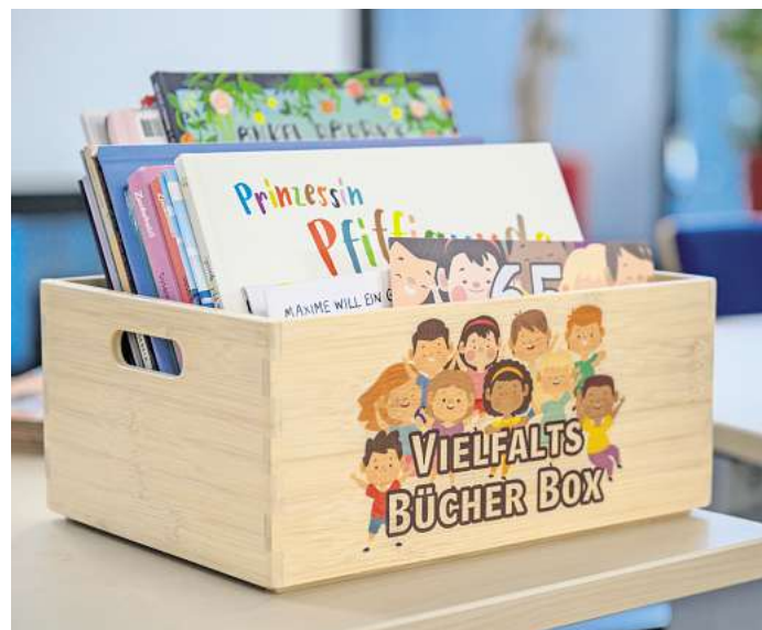
Die Stadt stattet alle 41 städtischen Kitas mit Bücherkisten aus, die Vielfalt auf kindgerechte Weise thematisieren.