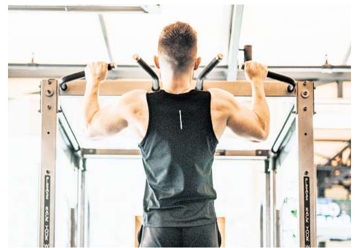
Peptide sollen den Trainingserfolg verbessern, sind aber gar nicht zugelassen.

Dass Peptide überhaupt online erhältlich sind, liegt an einer rechtlichen Grauzone. Die Anbieter tun so, als würden diese nicht für den