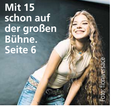
Mit 15 schon auf der großen Bühne. Seite 6