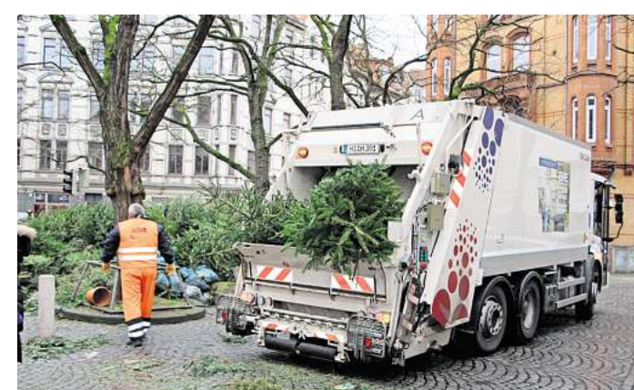
Die Abfallwirtschaft bietet auch 2026 wieder über 200 Sammelplätze im Stadtgebiet. Rund 170.000 Weihnachtsbäume werden eingesammelt.

Gut zu wissen: Große Bäume müssen gekürzt werden, damit sie in die Müllfahrzeuge passen. Eine Länge von 1,50 Meter darf