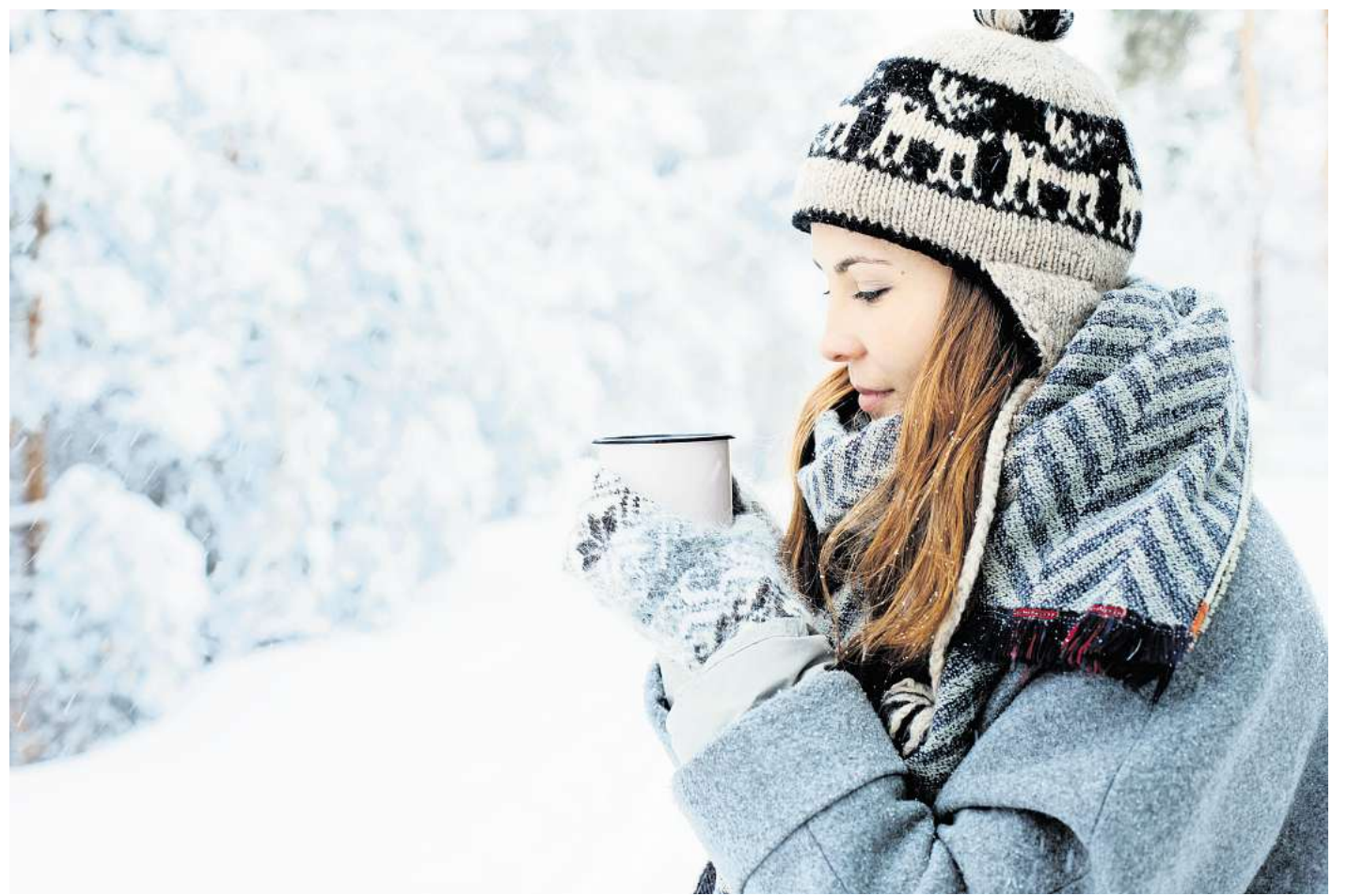
Zeit des Innehaltens: Die Raunächte laden dazu ein, Altes loszulassen und neuen Gedanken Raum zu geben.

In vielen Kulturen gelten die Tage nach Weihnachten als magisch. Die sogenannten Raunächte markieren seit Jahrhunderten eine Zeit des Innehaltens, der Reinigung und des Übergangs. Je nach Kulturkreis unterscheidet sich ihre Anzahl und ihre Zeitspanne, jedoch finden die Raunächte alle in der Zeit vor dem Dreikönigstag am 5./6. Januar statt. Mancher Volksglaube besagte einst, die Grenze zwischen den Welten sei in diesen Nächten durchlässiger, und viele