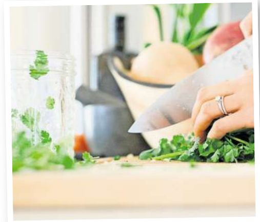
Aus Rucola und frischen Kräutern entsteht schnell ein frisches Pesto für Pastagerichte oder zu Kartoffeln.

Dieses Improvisations-Pesto passt wunderbar zu Pasta, Ofengemüse oder als Brotaufstrich und verhindert, dass gleich mehrere gute Zutaten im Müll landen. Je nach Mischung entsteht jedes Mal eine andere Geschmacksrichtung – von mild-nussig bis kräftig-würzig.