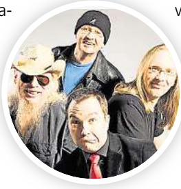
Moin! Torfrock feiert die „Bagaluten-Wiehnacht“.

► Der Harfenist Xavier de Maistre gastiert mit dem Belgrade Chamber Orchestra am Montag, 22. Dezember, ab 19.30