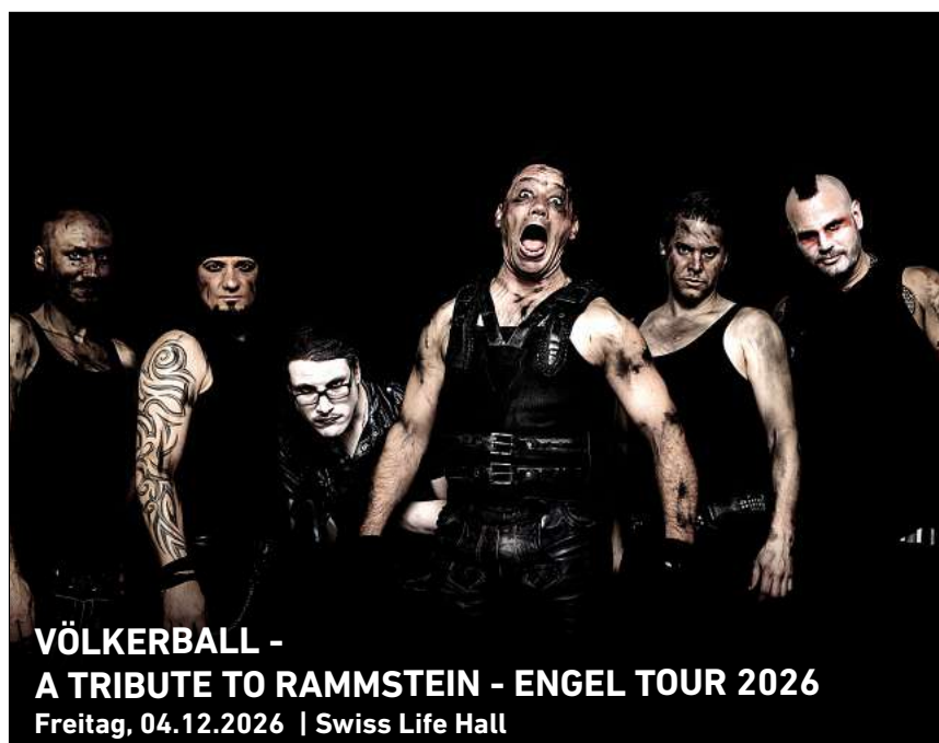
VÖLKERBALL - A TRIBUTE TO RAMMSTEIN - ENGEL TOUR 2026 Freitag, 04.12.2026 | Swiss Life Hall

Das Museum August Kestner, Platz der Menschenrechte 3, ist geöffnet dienstags, donnerstags, sowie freitags bis sonntags von 11 bis 18 Uhr und mittwochs von 11 bis 20 Uhr. Geschlossen bleibt es am 24. Dezember, 25. Dezember, 31. Dezember und 1. Januar. Es gilt der reguläre Museumseintritt, freitags ist der Eintritt frei. RED