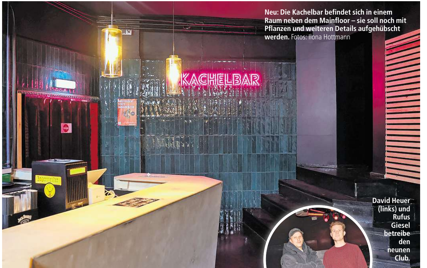
Neu: Die Kachelbar befindet sich in einem Raum neben dem Mainfloor – sie soll noch mit Pflanzen und weiteren Details aufgehübscht werden.

2019 verkaufte Gründer Sem Köksal (49) den Club. Sein Nachfolger Philipp „Friso“ Hoeksma versuchte, mit einem neuen Konzept an die legendären „Welspiele“ anzuknüpfen, die in den 1990er-Jahren in einem ehemaligen Kino an der Georg-