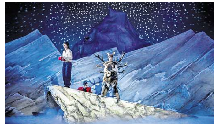
Wintermärchen: Das Schauspielhaus zeigt „Die Schneekönigin“.

► Weitere Termine und Tickets: staatstheater-hannover.de