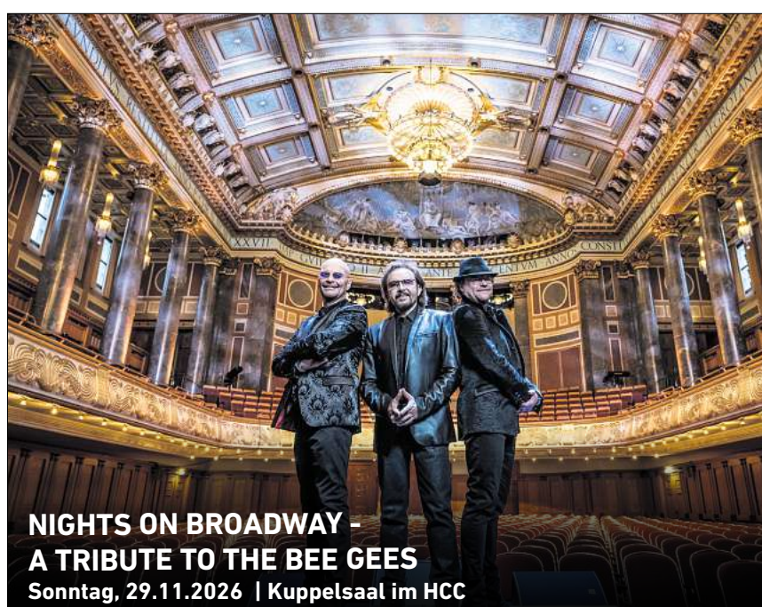
NIGHTS ON BROADWAY - A TRIBUTE TO THE BEE GEES Sonntag, 29.11.2026 | Kuppelsaal im HCC

Ihr persönlicher Ticketservice der HAZ & NP