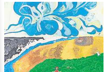
Auktion für einen guten Zweck.

HANNOVER. Farbe als Einladung, Landschaft als Möglichkeitsraum, Fantasie als gemeinsamer Nenner: Der Verein „Fliegende Blume Kunst hilft“ zeigt die Ausstellung „Fantasiereise & Landschaften“ – Kunst für den guten Zweck. Entstanden sind die Serien „Fantasiereise in die Vergangenheit – Fantasiereise in die Zukunft“ und „Landschaften“ 2022 bis 2023 in der Zusammenarbeit von Hobby- und Profikunstschaffenden. Der Verein arbeitet ehrenamtlich, inklusiv und integrativ; der Erlös aus Verkauf und Auktionen unterstützt das inklusive Theaterfestival Klatschmohn sowie das Frauenhaus Donna Clara in Laatzen. Eröffnung mit Auktion ist am Sonntag, 7. Dezember, ab 15 Uhr, die Finissage mit Auktion am Sonntag, 20. Dezember, ab 15 Uhr. Öffnungszeiten sind montags bis freitags von 8 bis 22 Uhr, am Wochenende von 10 bis 22 Uhr, im Freizeithaus Linden, Windheimstraße 4. Der Eintritt ist frei. RHR