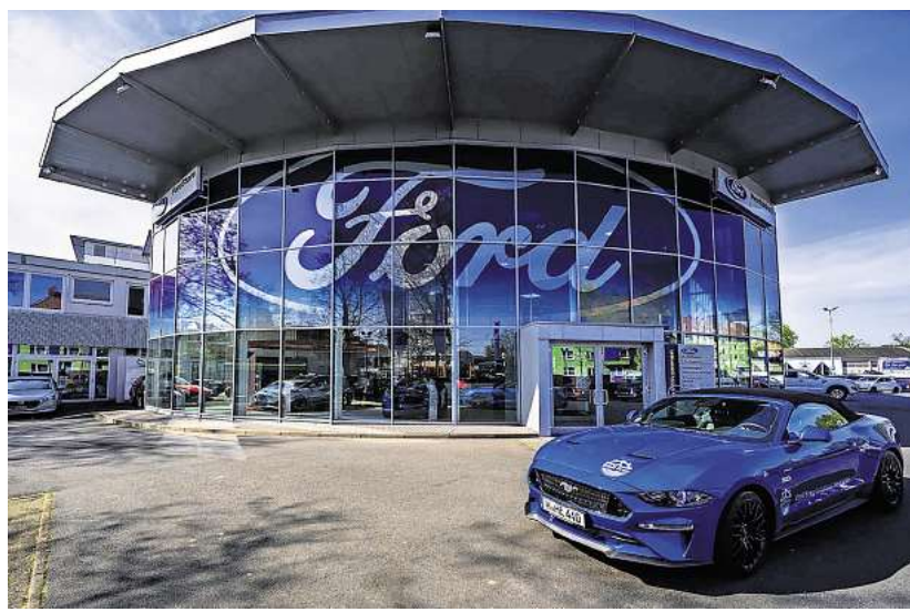
Vom Neuwagen bis zur Werkstattleistung: Das Familienunternehmen setzt auf Qualität, Verlässlichkeit und einen Service, der beim Kunden beginnt.