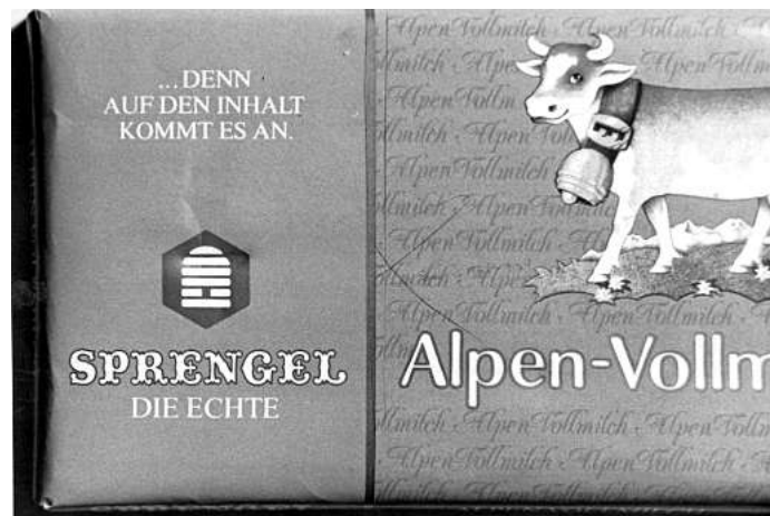
Klassiker aus Hannover: Tafel Schokolade mit Sprengel-Logo und Schriftzug, Foto von 1984.