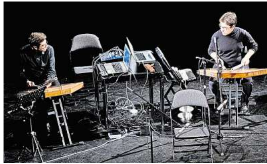
Das Duo Santronic spielt am 21. November in der FAUST Warenannahme.

► Sonabend, 22. November, 18 Uhr | FAUST Warenannahme