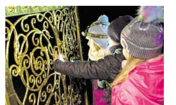
Entdeckungen auf der Taschenlampentour.

deres Abenteuer wartet am 12. Dezember 2025, wenn es heißt, gemeinsam das Geheimnis eines feurigen Treffens zu lüften. Wo wird das Feuer entzündet? Mit flinkem Geist und cleverer Unterstützung beim Rätseln finden Lili & Claudius die Antwort. Um 18 Uhr beginnt die Entdeckungstour, die etwa 120 Minuten dauert. Alle Touren richten sich an Kinder im Grundschulalter mit erwachsener Begleitung. Eine Anmeldung ist erforderlich. Weitere Informationen zu Treffpunkten, Preisen und Anmeldeöglichkeiten sind auf der Webseite lili-claudius.de zu finden. RED