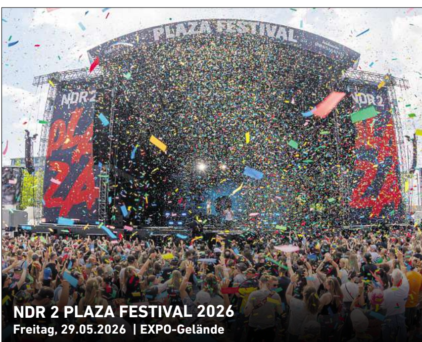
NDR 2 PLAZA FESTIVAL 2026 Freitag, 29.05.2026 | EXPO-Gelände