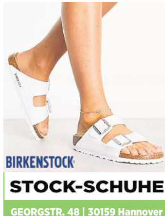
BIRKENSTOCK STOCK-SCHUHE GEORGSTR. 48 | 30159 Hannover