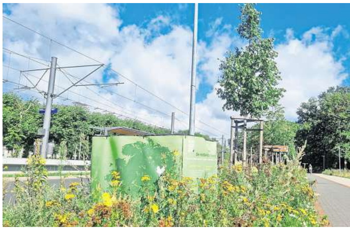
Unter anderem am Theodor-Heuss-Platz werden Messungen vorgenommen.