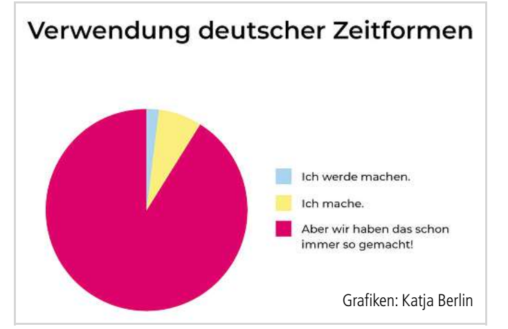
Grafiken: Katja Berlin