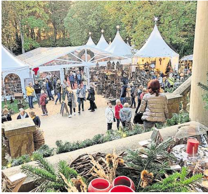
Die WinterTräume in Eldingen sind ein Fest für alle Sinne.