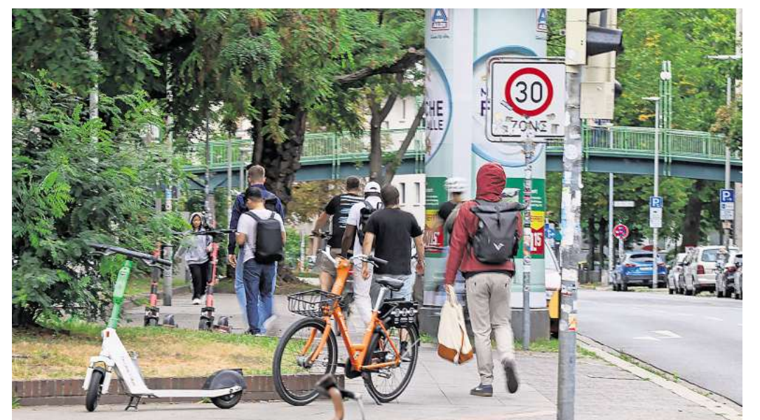
Oft zugestellt: Bürgersteige in Hannover, hier durch E-Scooter, Fahrräder und eine Litfaßsäule.