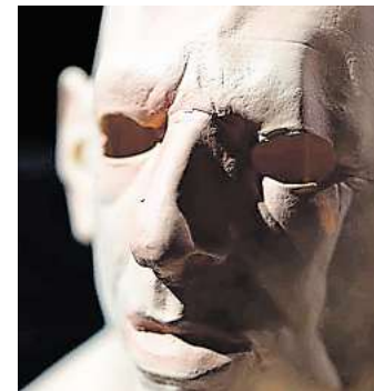
Das Theater an der Glocksee setzt den Mephisto-Stoff in einen hochaktuellen Bezug.

▣ Alle Termine und Vorverkauf: theater-an-der-glocksee.de