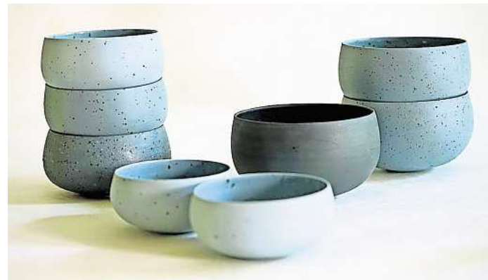
Nachhaltig: Schalen von Sigmund Servetti sind in der Handwerksform zu sehen. Foto: Sigmund Servetti, Handwerksform