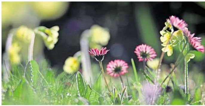
Im Kräuterrasen sind Wildkräuter wie etwa Gänseblümchen oder Schlüsselblumen enthalten.