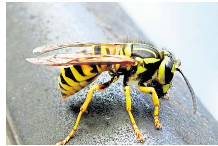
Wespen stehen unter Naturschutz.

Damit sich keine Wespe ins Haus verirrt, sollte man Fenster mit Insektengittern oder -netzen ausstatten. Und findet man doch mal eine drinnen, fängt man sie am besten mit einem Glas, schiebt ein Stück Papier unter und setzt sie wieder raus. „Man sollte eine Wespe auf keinen Fall töten“, sagt Breitreuz. Denn alle Wespenarten stehen unter Naturschutz. Was laut Breitreuz auch gegen Wespen im Garten hilft: Hornissen, „denn Wespen stehen auf dem Speiseplan von Hornissen“. Diese sehen zwar gruselig aus, sind aber nicht an unserem Essen interessiert.