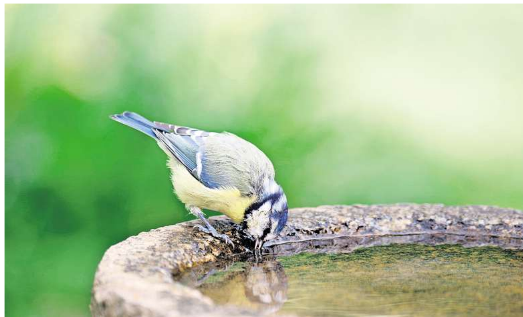
Eine Blaumeise trinkt Wasser aus der Vogeltränke.