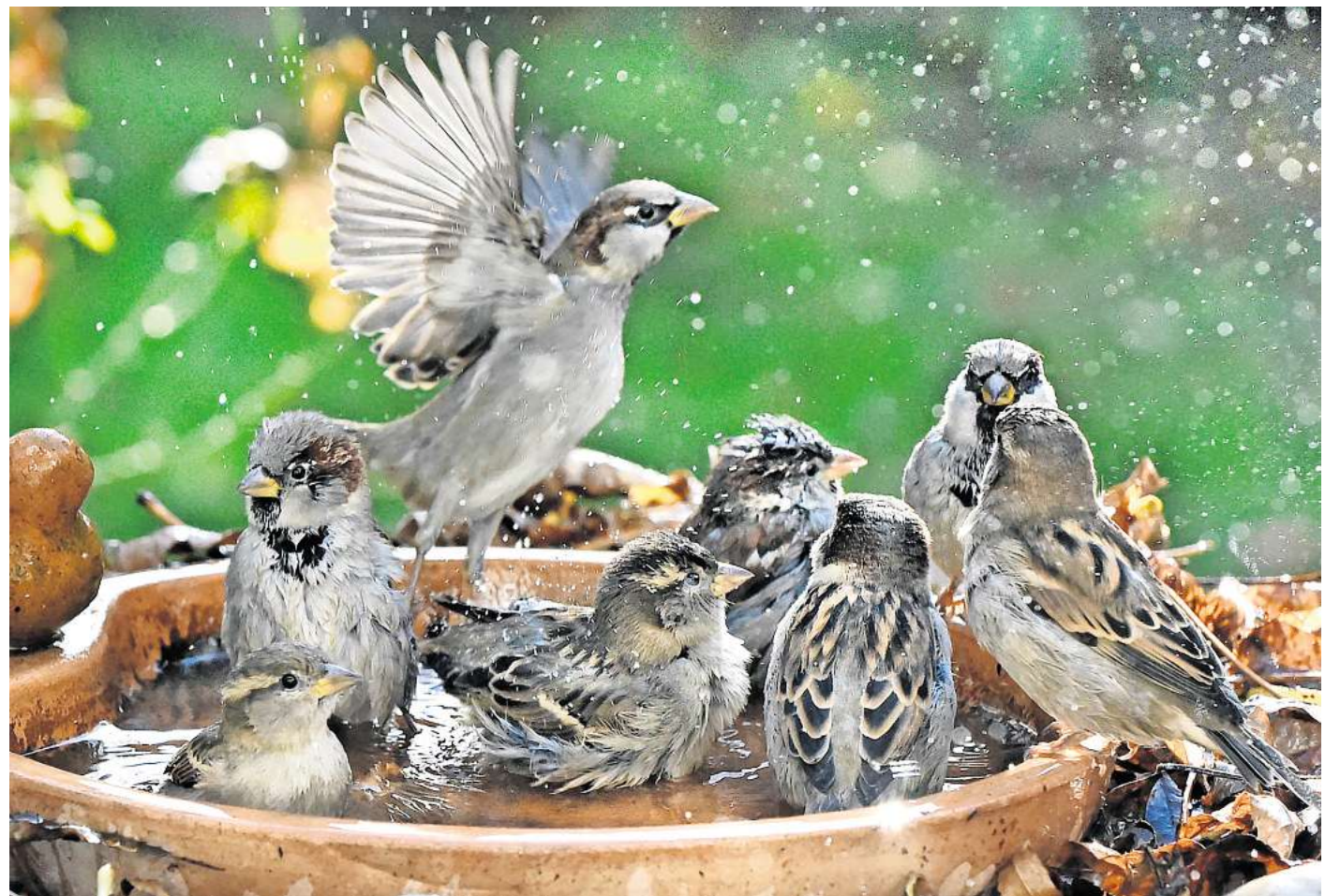
Badespaß im Garten: Auch Vögel freuen sich im Sommer über eine Möglichkeit zur Abkühlung.

Vögel nutzen Wasserstellen nicht nur zum Trinken, sondern baden auch gern darin. So kühlen sie sich an warmen Tagen ab und reinigen ihr Gefieder von Schmutz und Parasiten, die die