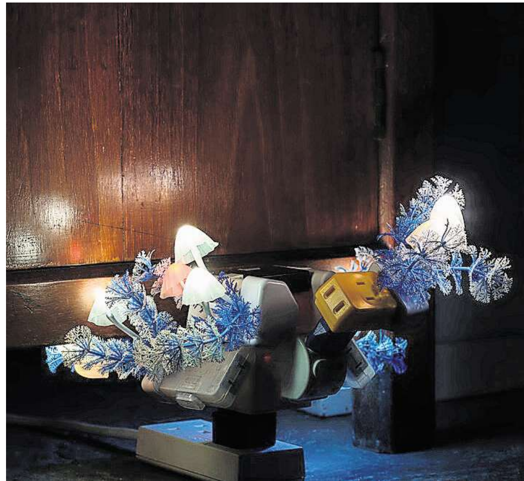
Trevor Yeung: Night Mushroom in shade (Teak Cabinet), 2024, im Auftrag von M+, 2024.

Ausgehend von seinem Wissen über Botanik und aquatische Ökosysteme entwickelt Yeung komplexe Arrangements, in denen pflanzliches Wachstum mit sozialen Dynamiken in Bezie-