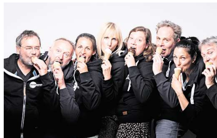
Impro-Theater: Bei den Improkokken entstehen die Stücke spontan auf der Bühne.

Informationen und Vorverkauf: impronover2025.de