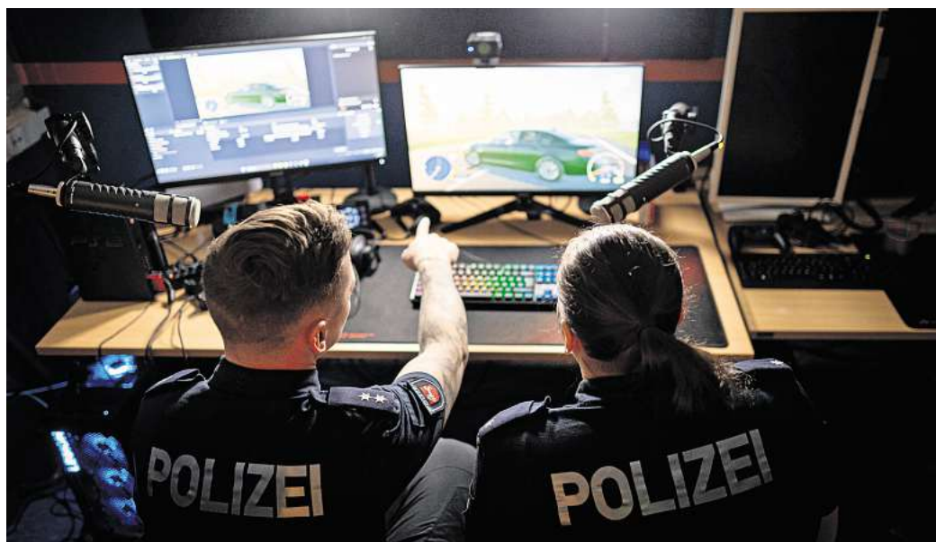
Gemeinsam zocken und Fragen beantworten: Hannovers Polizei geht nicht nur Streife, sie ist auch im Netz auf Plattformen wie Twitch präsent und ansprechbar.

Im Schnitt nutzen die fünf Beamten etwa fünf Stunden pro