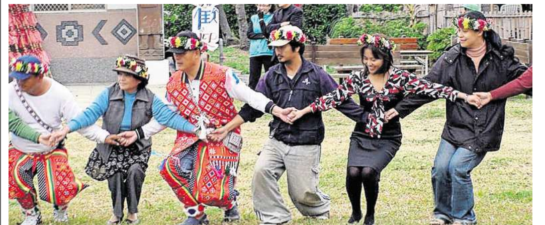
Mit Gesang und Tanz die Kultur der austronesischen Bevölkerungsgruppen Taiwans kennenlernen: Ein Workshop im Musik-Kiosk am Kröpcke lädt dazu ein.

➤ Eine Anmeldung ist erforderlich unter: UCOM-Jubilaeum@hannover-stadt.de