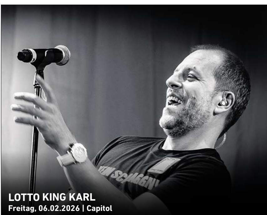
LOTTO KING KARL Freitag, 06.02.2026 | Capitol