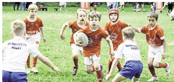
Die VfR-Jugend in Aktion.