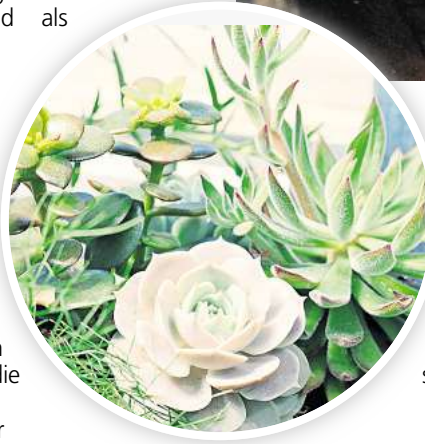
Luftreinigende Eigenschaften: Sukkulenten und Kakteen sind fast immer eine gute Wahl fürs Schlafzimmer.