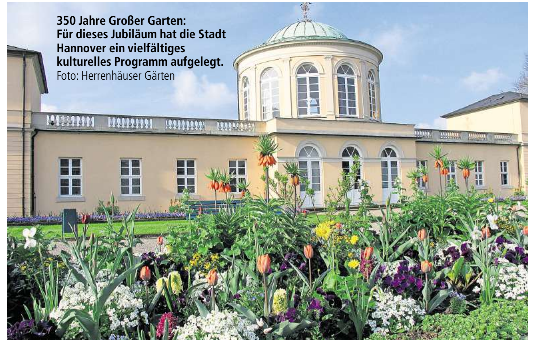
350 Jahre Großer Garten: Für dieses Jubiläum hat die Stadt Hannover ein vielfältiges kulturelles Programm aufgelegt.

Musik & Vortrag „Klanggarten in der Orangerie“