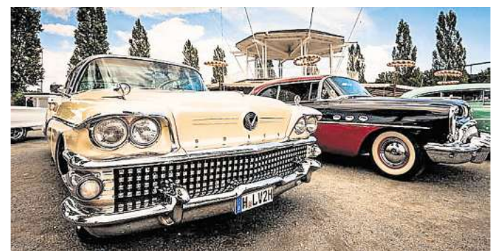
Heiß auf Blech? US-Straßenkreuzer gibt es auf Hannovers Schützenplatz zu bestaunen.

vette. Hot Rods und Muscle Cars treffen auf getunte Street-Machines. Am Sonntag-Nachmittag werden die Originellsten und Schönsten aus über 20 Klassen ausgezeichnet. Geöffnet ist jeweils ab 11 Uhr, Tagestickets gibt es für Gäste für 14 Euro an der Tageskasse, Wochenendtickets für 20 Euro, für ein US-Fahrzeug plus Fahrendem ab 12 Euro. RED