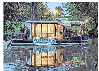
Bordkonzerte: Beim River Jam spielt die ZuKunst Bordband.

gleich ein Möglichkeitsraum. Unter anderem am Schiffsanleger des Heizkraftwerks Linden finden auf dem „Kultur+Zukunftsboot“ Communityangebote in den Bereichen Bildung, Umwelt, Integration und Kultur statt. Sonntags kann man auf den „Kulturbootsfahrten“ Hannover und seine Flüsse von der Wasserseite aus erleben, dazu gibt es ausgewählte Veranstaltungen an Bord und an den Ihme-Ufern. Bei der „ZuKunst-Jam-Session“ fügen Musi-