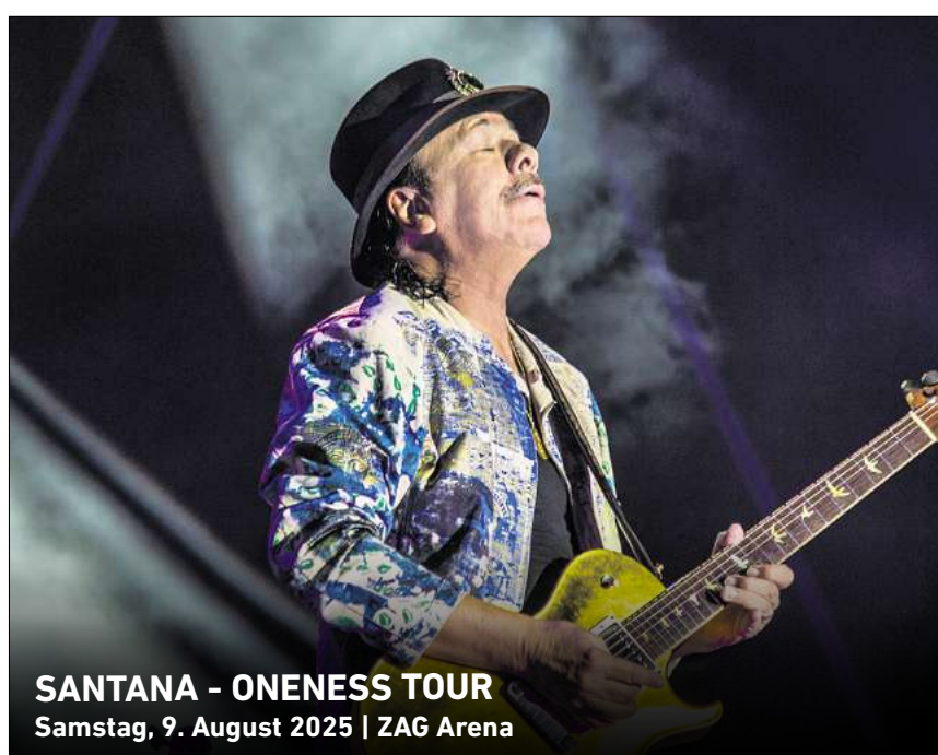
SANTANA - ONENESS TOUR Samstag, 9. August 2025 | ZAG Arena

HANNOVER. Zweite Runde für das Swampland: Nach einer gelungenen Festival-Premiere im vergangenen Jahr „bringen Psych- und Stoner-Rock Bands aus Niedersachsen ein glühendes Wüstenfeeling nach Norddeutschland“, versprechen die Veranstalter. Die Band Ghostones vereint treibende Bässe, Riffs und Orgeln zu starkem Rock mit Psychedelic-Einflüssen. Lilim spielen Progressive Stoner Rock, der auch die harten Gangarten beherrscht, und das Duo Gagaman hämmert stonerrockend auch gerne mal kräftig an die Türen des Metal. Als weitere Acts sind Dense Objects und Frida am Start. Das Festival beginnt am Sonnabend, 26. Juli, um 16 Uhr (Einlass: 15.30 Uhr) beim PlatzProjekt, Fössestraße 103. Bei schlechtem Wetter wird das Open-Air nach drinnen verlegt. Eintrittskarten gibt es für 20 bis 25 Euro. R/HR