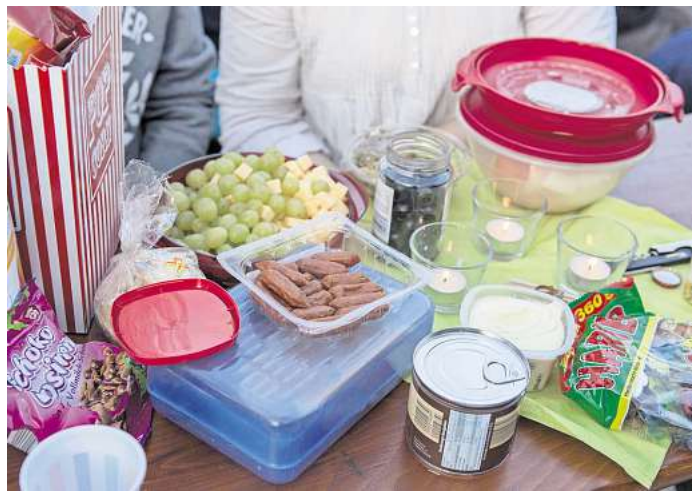
Ein reichhaltiges Picknick gehört für viel dazu: Die Gäste beim Seh-Fest bringen sich für einen gelungenen Kino-Abend ein.