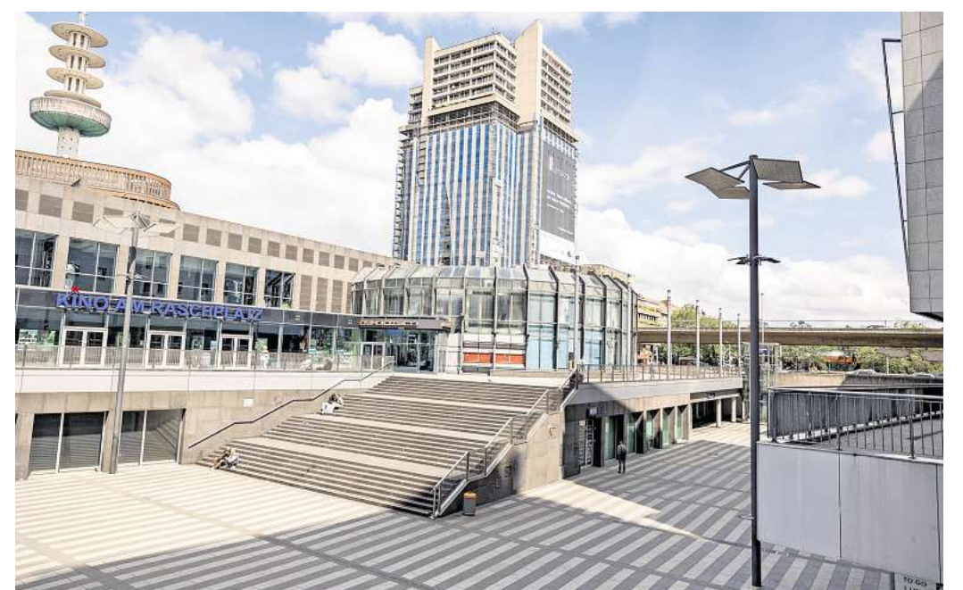
Leere am Raschplatz: In diesem Sommer gibt es dort aktuell kein Angebot.

Die Stadt Hannover hingegen will in Zukunft wieder Aktionen auf dem Raschplatz organisieren. „Die Stadt hat nach wie vor