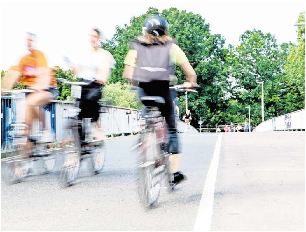
Wichtig für den Radverkehr: Die Dornröschenbrücke ist eine zentrale Verbindung zwischen Nordstadt und Linden-Nord.

Wie Holthaus-Voßgrüne berichtete, waren Kostentreiber