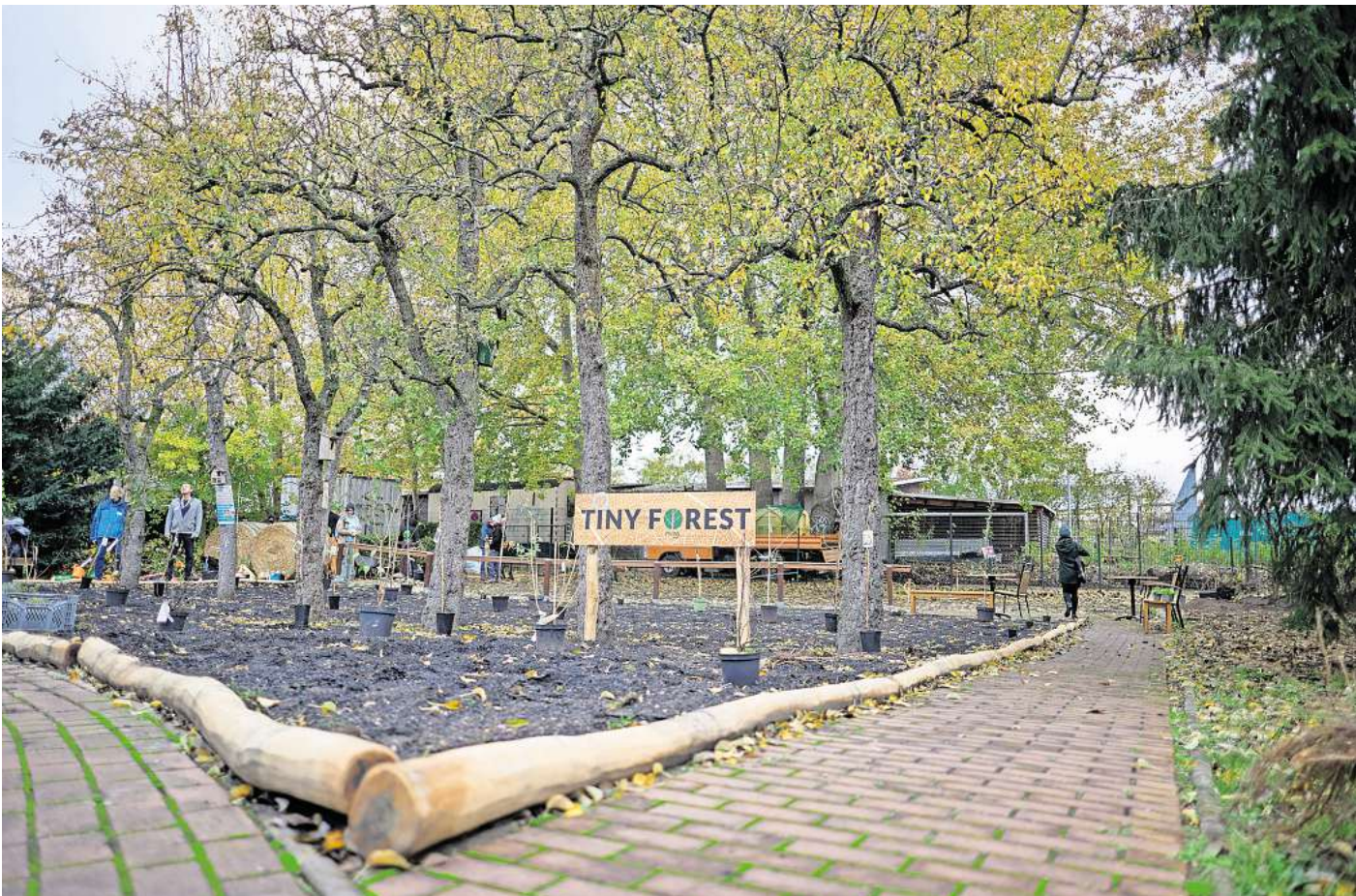
Das Projekt „Tiny Forest“ beruht auf der japanischen Miyawaki-Methode. Sie wird bereits international in urbanen Räumen als Klimaanpassungsmaßnahme, Erosionsschutz, Flutenschutz oder Lärmschutz eingesetzt, wie hier in Berlin.

Einige Bäume stehen auf der Fläche südlich der Aral-Tankstelle bereits, für weitere wird der Boden vorbereitet. Wenn die Bagger das Feld geräumt haben, will die Stadt mehr als 30