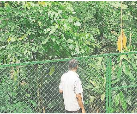
Dieses Bild zeigt, wie ein Mini-Wald bereits neun Monate nach den ersten Pflanzungen aussieht.

Die Stadt rechnet damit, dass die Arbeiten zum Ende des Frühjahres abgeschlossen sein können. Dann darf die Natur an dieser Stelle der dicht bebauten Großstadt ein Stück weit Fläche zurückerobern.