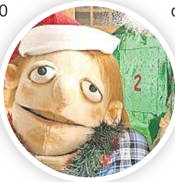
Im Theatrio öffnet Willi den magischen Adventskalender.

► Wer noch Inspiration für DekoratIVES braucht oder einfach Freude an schönen Dingen hat, sollte einen Blick werfen auf die „Christmas Edition 2024“. In der Ausstellung zeigt die Handwerksform, Berliner Allee 17, bis zum 15. Dezember eine Zusammenstellung von hochkarätigem, exklusivem, innovativem Kunsthandwerk bei freiem Eintritt. ► Selbst kreativ werden dürfen Gäste am Freizeitheim Lister Turm, Walderseestraße 100, wo der „Adventskalender an der Leine“ wieder Buntes zum Staunen und Nachmachen in kleinen Tütchen bietet. Vom 1. bis 24. Dezember heißt es: Zugreifen, solange der Vorrat reicht. Außerdem am Lister Turm: das Winterdorf im Biergarten, wo jeden Donnerstag im Advent die Wichtelwerkstatt Kinder ab sechs Jahren zum Basteln einlädt, jeweils ab 14.30 Uhr. ► Beim Lebendigen Adventskalender in Misburg-Anderten öffnet sich jeden Tag eine neue Tür im Stadtteil. Los geht es am 1. Dezember von 14 bis 17 Uhr mit dem Winterflohmarkt und Workshop für Kinder „Weihnachtswundern“ am und im Bürgerhaus Misburg, Seckbruchstraße 20. ► Am ersten Adventswochenende laden darüber hinaus zahl-