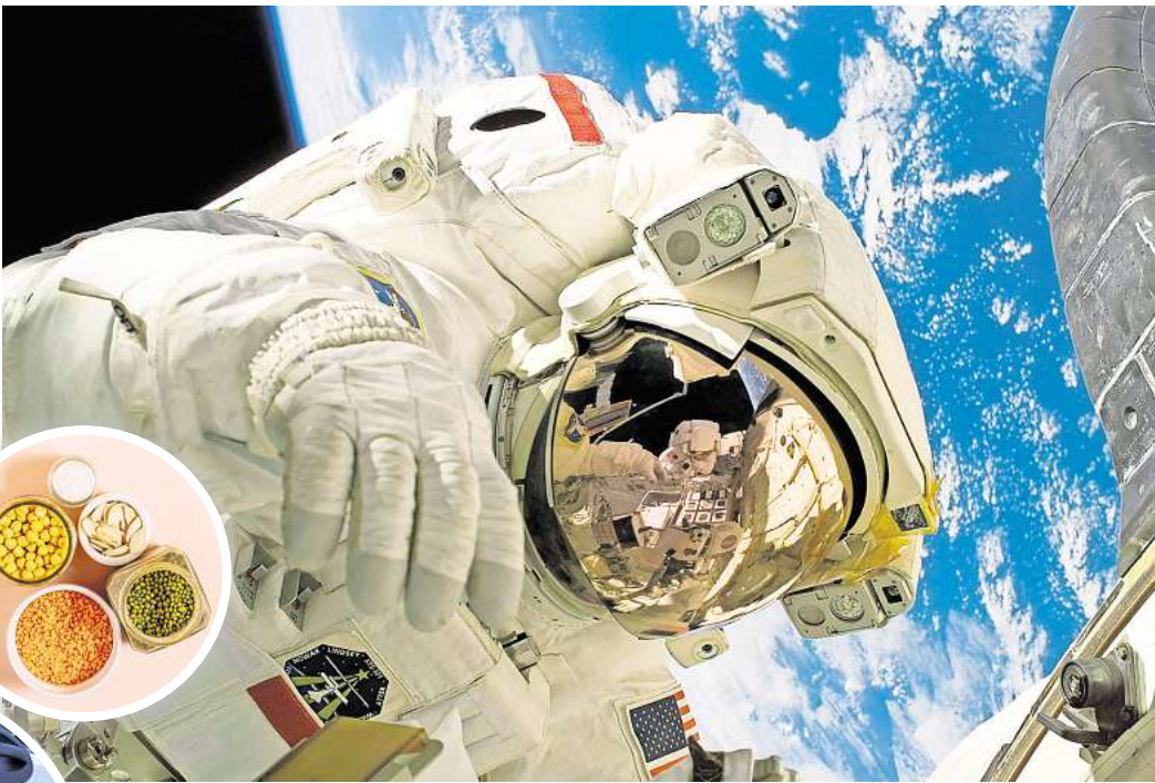
Hannovers Hochschulen beleuchten das Thema Nachhaltigkeit aus unterschiedlichen Perspektiven. So geht es unter anderem um Raumfahrt, klimafreundliche Ernährung sowie Mobilität und Logistik.