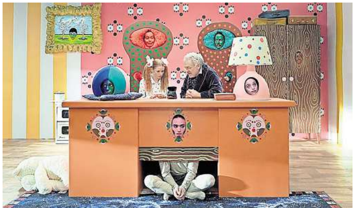
Roe Rosen: „Kafka for Kids“, Videostill, 2022.