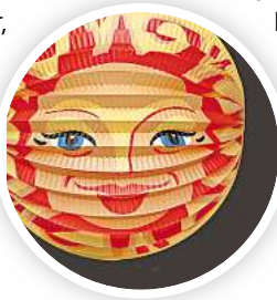
Zeit für bunte Laternen.

brunnen auf dem Vahrenheider Markt treffen sich die Laternelaufenden am 15. November um 18 Uhr, es geht dann durch den Grünzug mit einem musikalischen Zwischenstopp beim Seniorenheim Erlenhof. R/HR