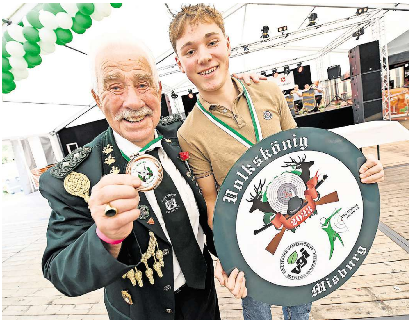
Großes Vergnügen für alle Generationen: Die Uniformierte Schützengesellschaft Misburg von 1862 e.V. vereint Jung und Alt.