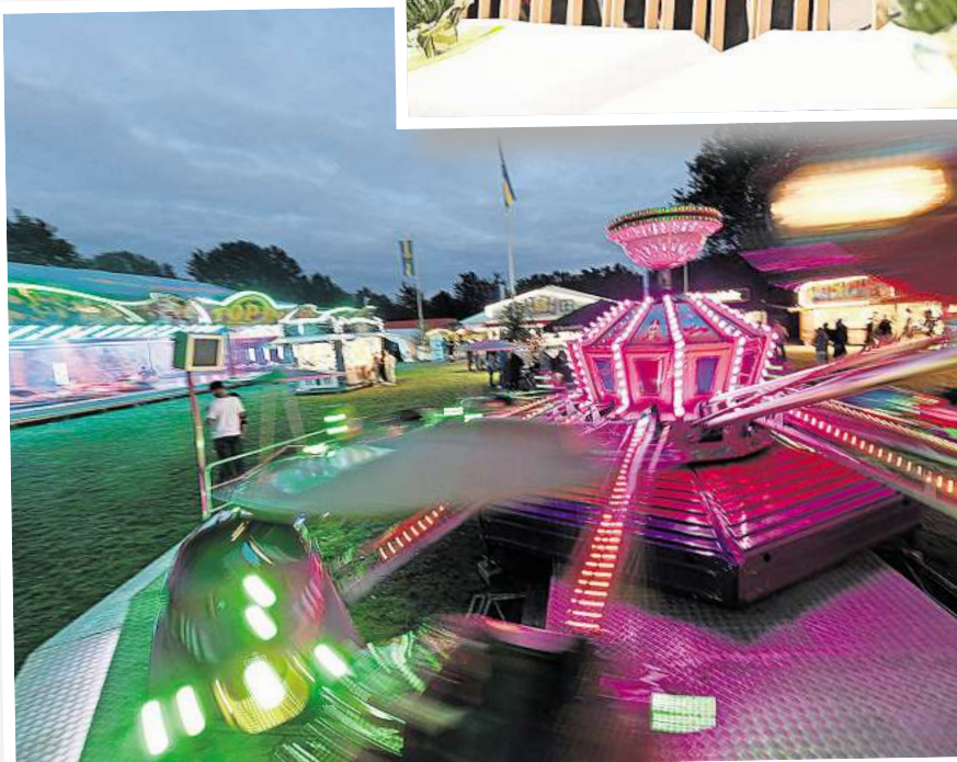
Drei Tage läuft die Sause auf dem Schützenplatz an der Ludwig-Jahn-Straße – mit Autoscooter, Live-Musik und Kinderdisco.