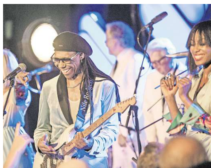
Nile Rodgers gastiert mit Chic auf der Gilde Parkbühne.

Am Sonntag, 30. Juni, ab 20 Uhr, gastiert Nile Rodgers mit Chic auf der Gilde Parkbühne. Tickets gibt es ab 71,25 Euro plus Gebühren an den bekannten VVK-Stellen sowie unter www.hannover-concerts.de oder www.myticket.de