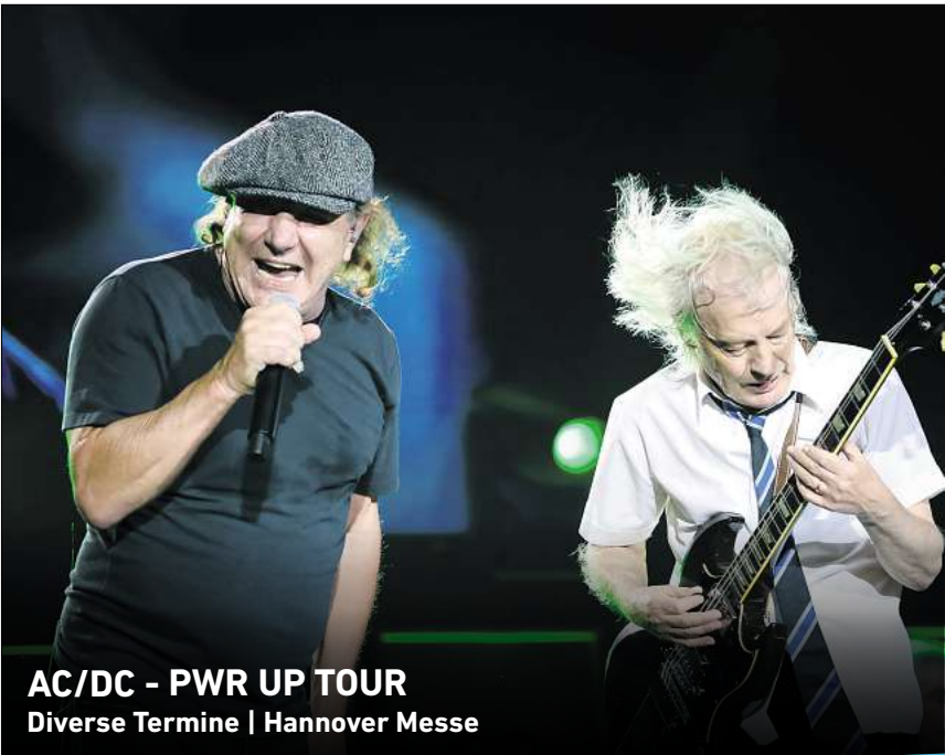
AC/DC - PWR UP TOUR

Ihr persönlicher Ticketservice der HAZ & NP