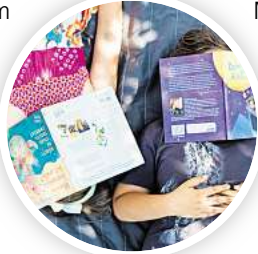
Eintauchen in die bunte Welt der Bücher.

In der Woche vom 13. bis 17. Mai finden im Festivalzentrum im Zirkuszelt am Neuen Rathaus sowie im Freizeitheim Vahrenwald Lesungen und Workshops für Kitas und Schulklassen der Jahrgänge 1 bis 10 statt. Unter anderem werden kaputte Bücher repariert oder mit Upcycling zu etwas Neuem gemacht, außerdem können Comics mit