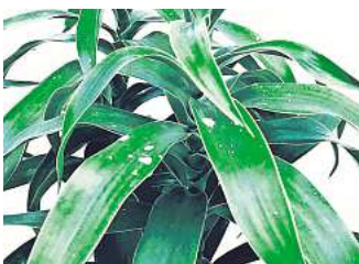
Wie klingen Zimmerpflanzen?

Termine und Projekt-Updates: stroeme.info