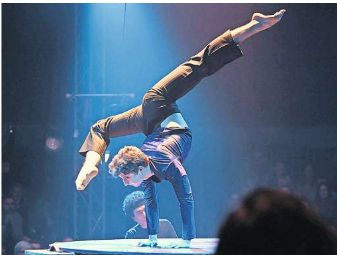
Paraiso, die neue Inszenierung des Cirque Bouffon, entführt in eine poetische Traumwelt.

Showtime ist Mittwoch bis Freitag 19.30 Uhr, Sonnabend 14.30 und 19.30 Uhr, Sonntag 14.30 und 17.30 Uhr, Montag und Dienstag keine Vorstellun-gen, außer am Ostermontag, 1. April, 14.30 und 17.30 Uhr. Am Karfreitag, 29. März, findet kei-ne Vorstellung statt. Vorverkauf in Hannover über Reservix, west-ticket, eventim und an der Kasse am Zirkuszelt (ab zwei Stunden vor jeder Vorstellung ohne VVK-Gebühren)