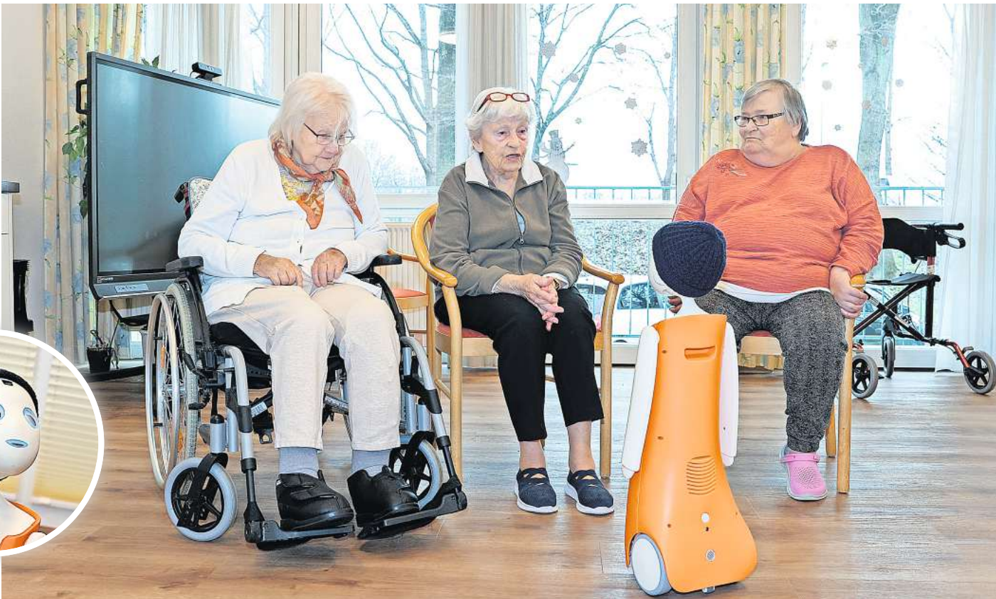
Ricky ist ein niedlicher Roboter, der im Johanniter-Stift in Ricklingen Senioren unterhält.

Ricky heißt eigentlich Navel, ist ein Geschöpf des Münchner Start-ups Navelrobotics, und soll – ausgestattet mit Kameras, Sen- soren und Hochleistungsprozessoren – einen Teil der sozialen Betre- uung in Senioreneinrichtun- gen übernehmen. Ricky, sein neuer, auch neu programmierter Name ist vom Ort Ricklingen ab- geleitet. Er ist einer von zwei Ro- botern, die bundesweit in Johan- niter-Häusern getestet werden. Ein halbes Jahr soll er bleiben, „mit der Option auf Verlänge- rung – je nachdem, was er dann schon kann“, berichtet Stiftslei-