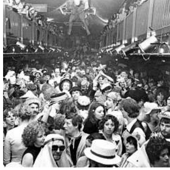
Kult-Location: die Rotation.