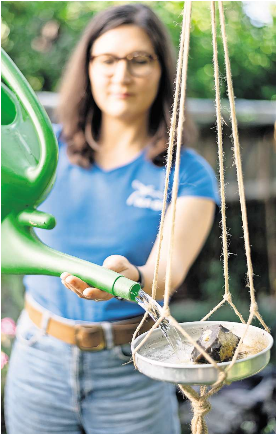
Naturnah Gärtnern: Wasserstellen sollten Tieren Ausstiegsmöglichkeiten geben, zum Beispiel kleine Steine.

Mit diesen einfachen Maßnahmen lässt sich schon auf kleinstem Raum ein wichtiger Beitrag leisten, damit heimische Tierarten die heißen Sommerwochen unbeschadet überstehen. Jeder Quadratmeter zählt – ob Balkon, Terrasse oder Garten – um in Zeiten zunehmender Trockenheit neue Oasen für die Natur zu schaffen.