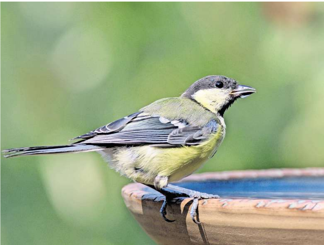
Vogeltränken sollten eine rauen Boden haben, damit die Tiere Halt finden.