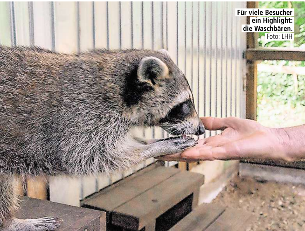
Für viele Besucher ein Highlight: die Waschbären.

Alle Infos und Termine findet Ihr hier: www.waldstation-eilenriede.de