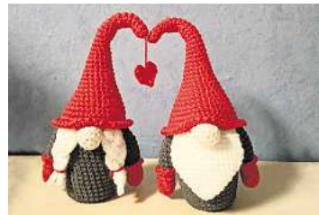
2. Platz: Katharina Meine (Uetze)