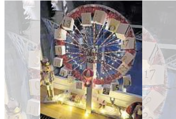
1. Platz: Janina Gundelach (Hannover)