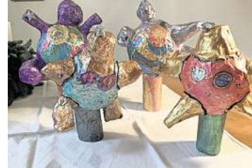
1. Platz: Romy Doebele (Hannover)