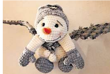
1. Platz: Bettina Tegtmeier (Ronnenberg)