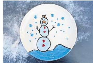
3. Platz: Irma Schlicker (Hannover)