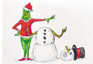
3. Platz: Ingo Stein (Wedemark)