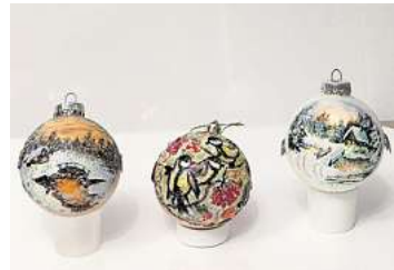
2. Platz: Rimma Schilmover (Laatzen)