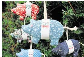
3. Platz: Laura Eicke (Hemmingen)