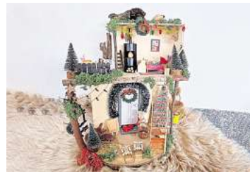
2. Platz: Maja Hüters (Hemmingen)