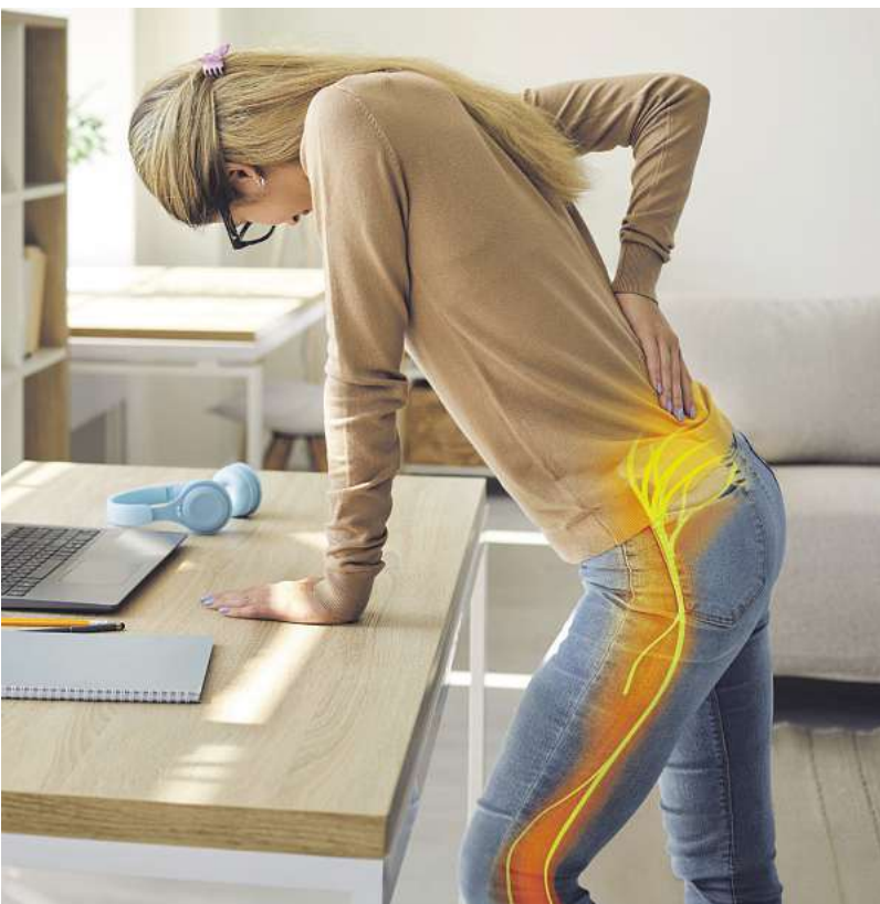
Der Ischiasnerv kann bis zu 40.000 Nervenfasern enthalten, die Informationen zwischen dem Gehirn und den Beinen transportieren.

handlung von Nervenschmerzen, wie z. B. bei einer Ischialgie, entwickelt wurden. So wird etwa der Arzneistoff Iris versicolor in Restaxil laut Arzneimittelbild vor allem bei Ischialgien mit ziehenden, reißenden und brennenden Schmerzen im Hüftnerv