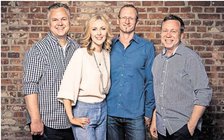
Mal swingend, mal soulig: Die Ellingtones nehmen das Publikum mit auf eine faszinierende Entdeckungsreise durch die Musik der letzten Jahrzehnte.

Aus dieser Idee wuchs eine seit 20 Jahren längst etablierte Musikreihe, die vor allem eines zum Ziel hat: Vorurteile gegenüber psychischen Erkrankungen abzubauen und ein Gemeinschaftserlebnis zu schaffen. Vor nun fast einem Jahr ist der frühe-