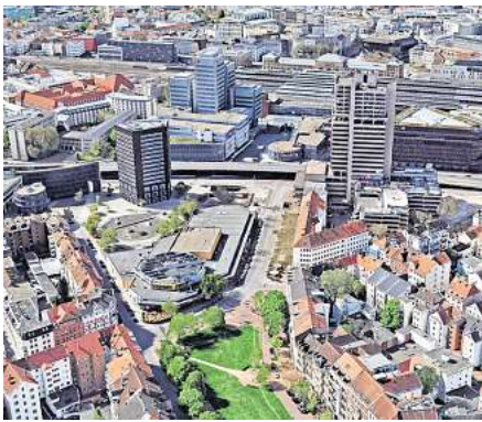
So ist die Realität: Die Stadt Hannover lässt derzeit einen Masterplan für die Entwicklung des Areals nördlich vom Hauptbahnhof entwickeln. Er sieht u. a. in drei Varianten mehr Grün, klarere Wege und Platzstrukturen und zusätzliche Hochhäuser vor.

In einer 60-seitigen Studie, die auf der Internetseite der Stadt abrufbar ist (Stichworte: nördlich Hauptbahnhof) sind die wichtigsten Analysen und die drei Varianten des Masterplans zusammengetragen.