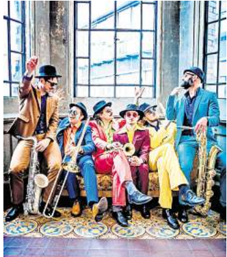
Heißer Tipp in der Brass-Band-Szene: Brazzo Brazzone stehen für unverschämten World Brass Groove in knallbunten Outfits.