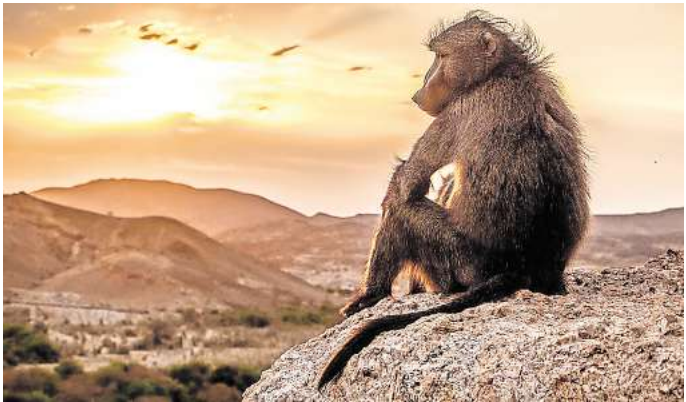
Sinfoniekonzert und Naturdokumentation: „Planet Erde III“

Eintrittskarten und nähere Informationen: planet-erde-live.de