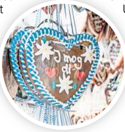
Bayrische Tradition trifft norddeutschen Rummel auf dem Oktoberfest.

Oktober werden ab 19 Uhr in der Festhalle Marris die Miss Dirndl und der Mister Lederhose gekürt, am 4. und 5. Oktober sorgt dort Hoamatwind für Stimmung, am 11. Oktober die Partymafia und am 6. Oktober wird es regenbogenbunt statt blau-weiß beim Gaytoberfest mit Dick & Durstig. An allen anderen Abenden ist „Bayerngaudi“ mit DJ Marcel angesagt. RED