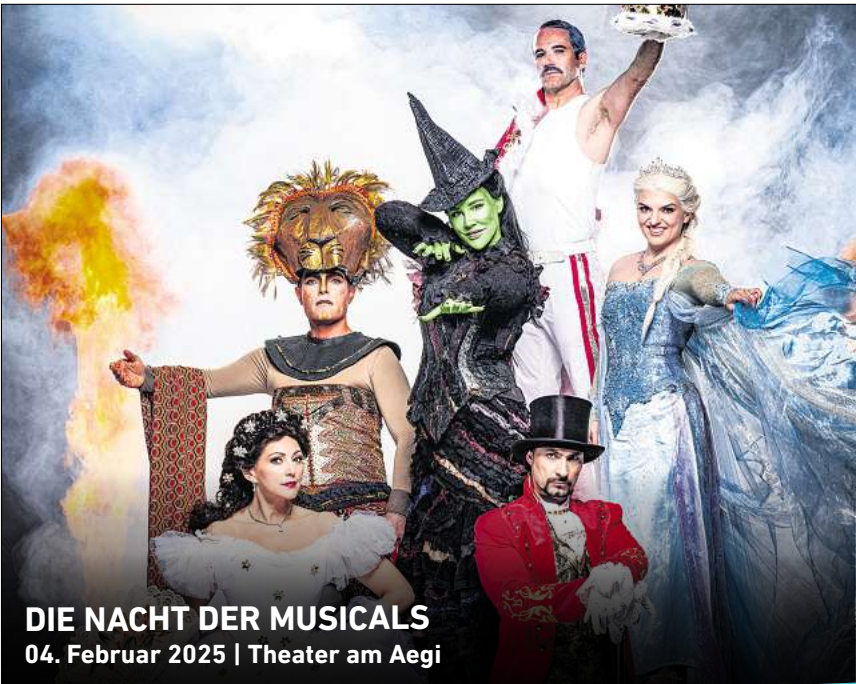
DIE NACHT DER MUSICALS 04. Februar 2025 | Theater am Aegi

Ihr persönlicher Ticketservice der HAZ & NP