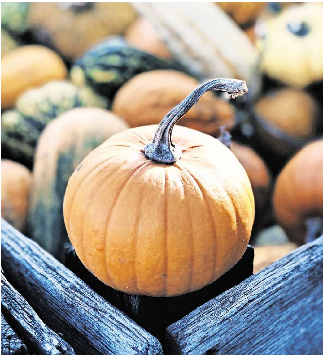
Kürbisse und mehr warten bei Erntefesten in der Region Hannover.

Wer einen naturkundlichen Herbstspaziergang genießen möchte, kann zum Beispiel immer freitags und noch bis 18. Oktober an einer geführten Wanderung ins Naturschutzgebiet „Totes Moor“ teilnehmen. Es geht um Spezialisten wie Torfmoos, Sonnentau und Wollgras,