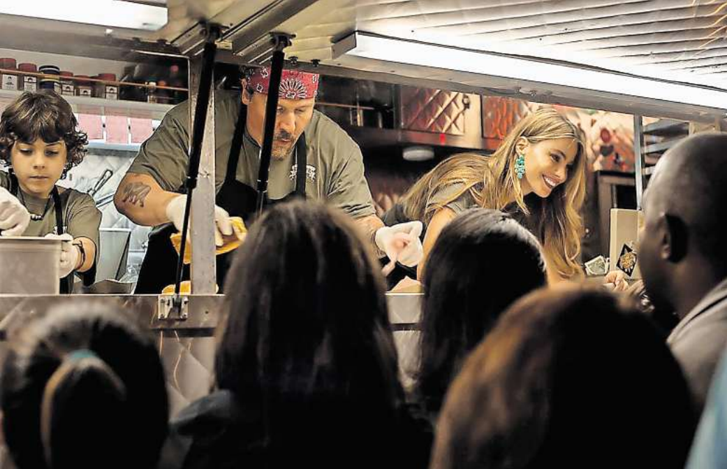
Wohlfühl-Komödie: Das Cinema del Sol zeigt „Kiss the Cook - So schmeckt das Leben“ unter freiem Himmel auf dem Andreas-Hermes-Platz.

Brad Pitt, Tom Cruise und Kirsten Dunst spitzen die Zähne als Blutsauger in „Interview mit einem Vampir“ am Montag, 9. September. Düster-romantisch und schwermütig geht es durch die Jahrhunderte und um die Frage, wann die Ewigkeit sinnlos wird.